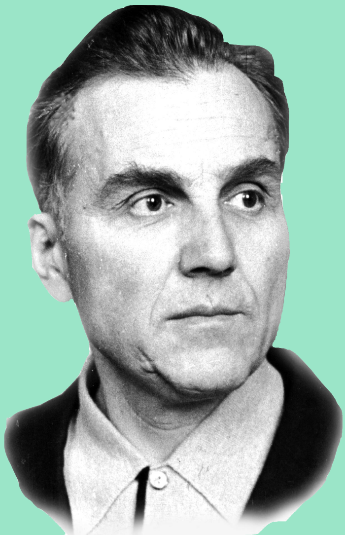
В.А.Сухомлинский (1918-1970), советский педагог, писатель, публицист

Ребенок должен быть уверен, что успехом он обязан, прежде всего, самому себе. Помощь учителя, какой бы эффективной она не была, все равно должна быть скрытой. Стоит ребенку почувствовать, что открытие сделано с помощью подачи учителя....