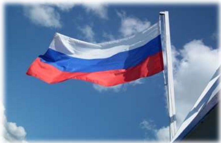
Церемония поднятия (спуска) Государственного флага Российской Федерации.