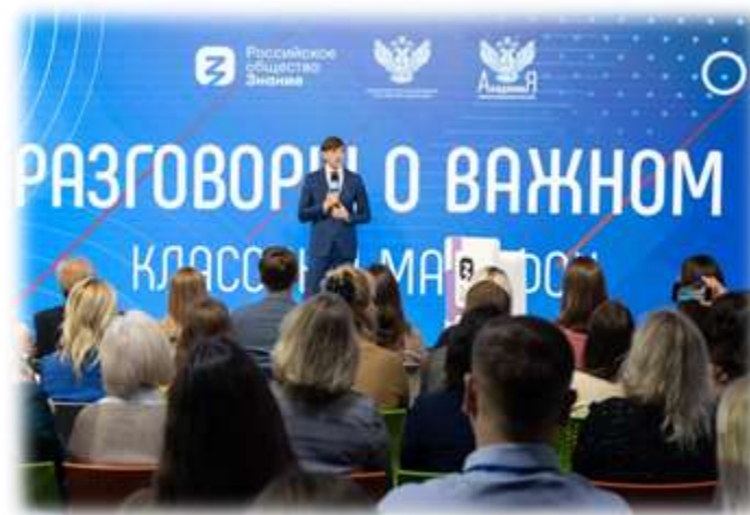
Информационно- просветительские занятия «Разговоры о важном»