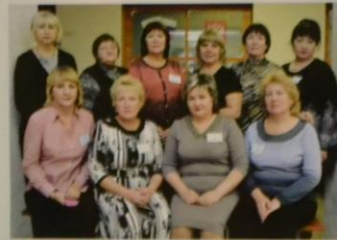
Состав цикловой комиссии рабочих профессий