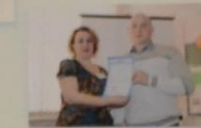
Презентация группы профессионального мастера на профессии «Мастер слесарно-ремонтных и слесарно-монтажных работ»