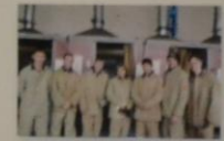
«Стандарты профессионализма и качества СМЭП «Профессионализм» сварочной лаборатории»