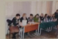
Конкурс профессионального мастера на профессии «Мастер слесарно-ремонтных и слесарно-монтажных работ» Члены жюри.