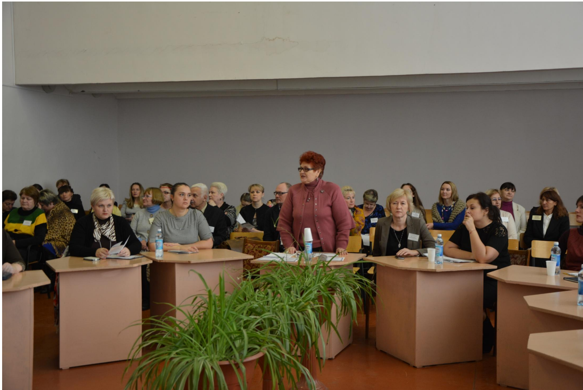
Представление участников конференции