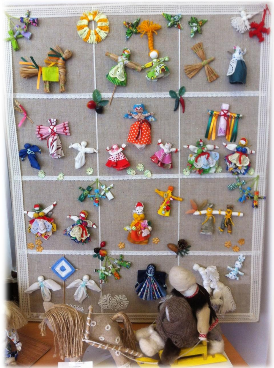
Выставка декоративно-прикладного творчества