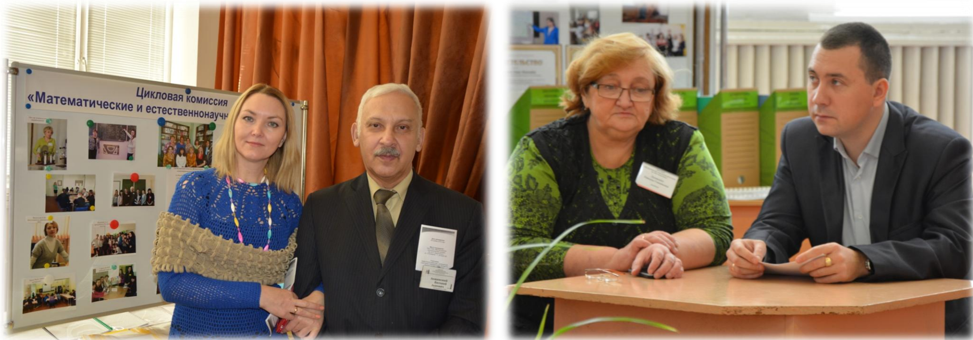
Участники и гости конференции

За активное участие в выставке интеллектуальной продукции сертификаты получили педагоги Магнитогорского технологического колледжа им. В.П. Омельченко: