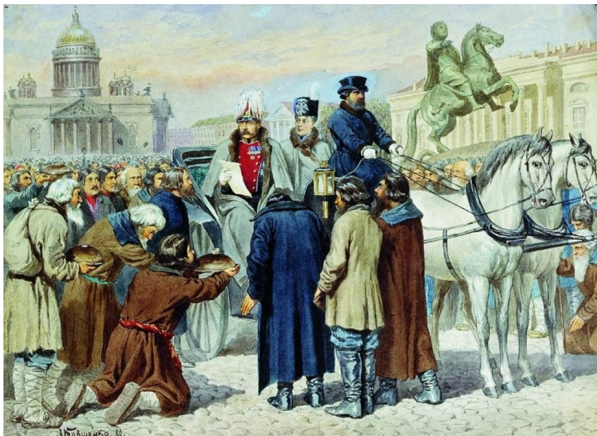
Рис. 3 Образец оформления иллюстраций

Фотография – особенно убедительное и достоверное средство наглядной передачи действительности. Она применяется тогда, когда необходимо с документальной точностью изобразить предмет или явление со всеми его индивидуальными особенностями. Во многих отраслях и техники фотография – это не только иллюстрации, но и научный документ. К фотографии в исследовании помимо чисто технических требований (четкость изображения, качество отпечатков и т.п.) предъявляются еще требования особого рода. Так как фотографирование здесь осуществляется как часть целого, а не как самостоятельное произведение фотоискусства, эти требования сводятся к определенному подчинению отдельного снимка общему замыслу работы. Общее требование соответствия конкретизируется функцией, которую несет изображение.